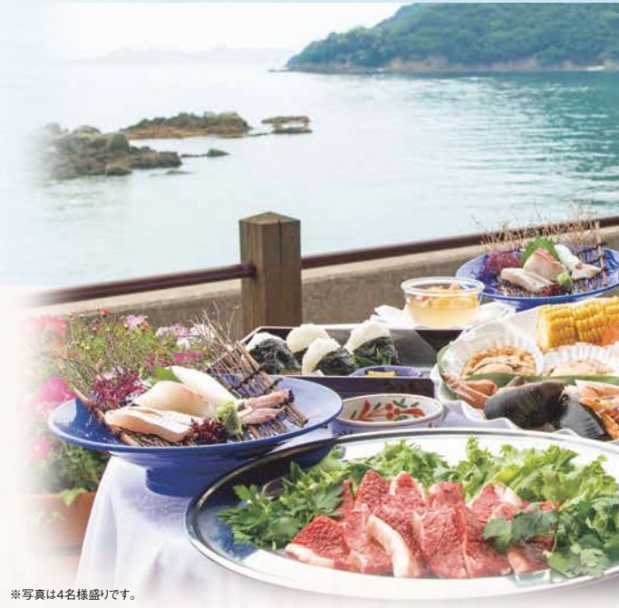
※写真は4名様盛りです。