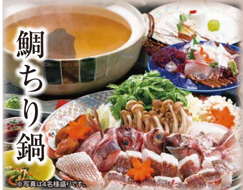
※写真は4名様盛りです。